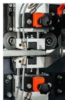
Racleur de surface avec palpeur double