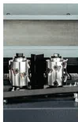
Fraises à calibrer diamantées